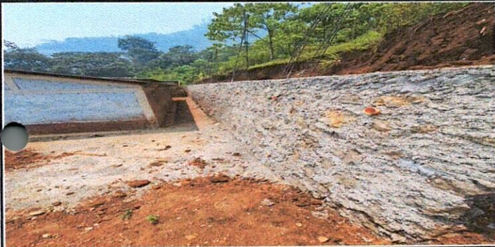
Foto1: MURO TERMINADO AL 100%